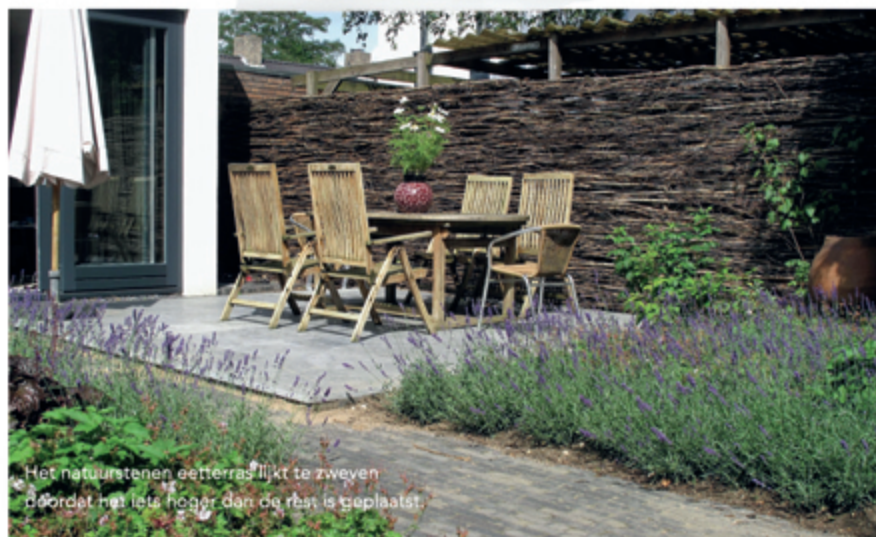
Het natuurstenen eetterras lijkt te zweven doordat het iets hoger dan de rest is geplaatst.